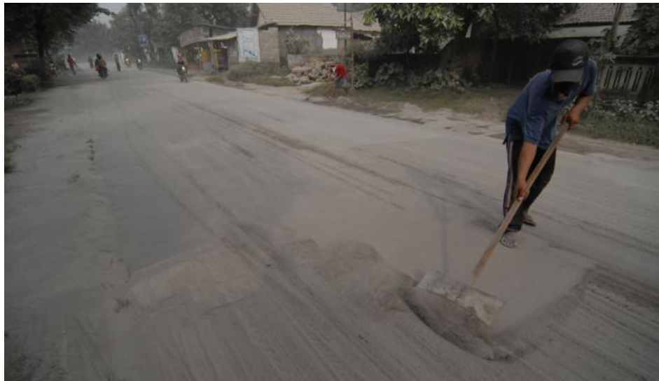
Gambar 4. Abu vulkanik yang menimbun jalan di Kediri, Jawa Timur

Sebaran abu vulkanik yang mengendap menyebabkan hilangnya daerah tangkapan air, sehingga penduduk yang berada disekitar gunung akan kesulitan untuk mencari air bersih. Sumber-sumber mata air alam seperti sungai danau maupun mata air tercemar akibat abu ini. Banjir lahar dingin yang terjadi akan merusak lahan lahan yang dilewatinya bahkan juga mengalir pada sungai-sungai. Lahan yang di lewati akan terkubur dan mengakibatkan terhambatnya pembentukan tanah akibat erupsi yang berulang-ulang. Abu vulkanik yang tersebar juga menyebabkan tertutupnya jalan-jalan akses yang melewati kawasan tersebut dan akses lahan pertanian dan hilangnya batas-batas kepemilikan lahan.