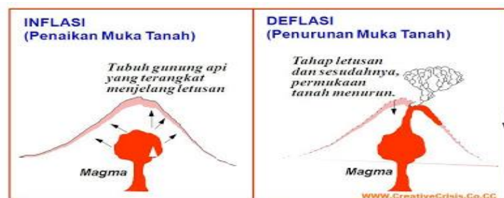
Gambar 1. Dorongan magma terhadap tanah mendorong terjadinya erupsi

Abu Vulkanik merupakan butiran halus ringan, bundar, tidak porous, mempunyai kadar bahan semen yang tinggi dan mempunyai sifat pozzolanik, yaitu dapat bereaksi dengan kapur bebas yang dilepaskan semen saat proses hidrasi dan membentuk senyawa yang bersifat mengikat pada temperatur normal dengan adanya air. Dalam beberapa letusan gunung berapi yang terjadi, awan yang bergumpalan akan naik ke atas gunung, sungai lava akan mengalir di setiap sisi gunung tersebut. Pada letusan lain, abu merah yang panas dan bara api menyembur keluar dari uncak gunung dan bongkahan besar bebatuan akan terlempar tinggi ke udara. Sebagian kecil letusan memiliki kekuatan yang sangat luar biasa sehingga bisa memecah belah gunung.