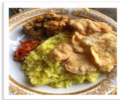
Gambar 4. Nasi Madhi Rabeg Vegetarian

Sesudah dilaksanakan program PPM, Nasi Mandhi yang telah dipadukan dengan Rabeg Vegetarian ini memiliki rasa yang unik. Mulai dari bahan dasar Rabeg hingga pelengkapannya seperti kerupuk emping dan sambal telur balado yang lebih menggugah rasa, serta berpotensi diminati oleh masyarakat luas karena memiliki kandungan gizi kesehatan yang jauh lebih baik serta harganya yang terjangkau.