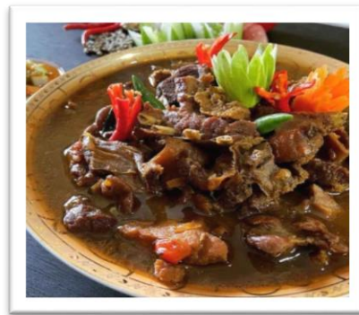
Gambar 1. Rabeg

Sebelum dilaksanakannya program PPM, Rabeg adalah sejenis makanan utama Indonesia berupa semur daging yang terbuat dari daging kambing. Rabeg memiliki rasa pedas dan Rabeg pun berasal dari Kota Cilegon ( jdih.jombangkab.go.id ).