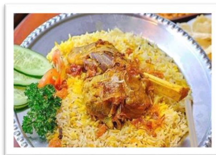
Gambar 3. Nasi Mandhi

Sebelum dilaksanakannya program PPM, Nasi Mandhi yang merupakan makanan khas Timur Tengah. Biasanya menggunakan daging seperti ayam, kambing dan sapi