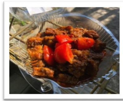
Gambar 2. Rabeg Vegetarian

Sesudah dilaksanakan program PPM, Rabeg memiliki rasa yang unik karena berbahan dasar kedelai dan tempe yang disatukan bersama dengan bumbu Rabeg dari keunikan bahan dasar tersebut Rabeg pun akan lebih banyak diminati oleh masyarakat karena makanan tersebut memiliki khasiat kesehatan yang jauh lebih baik serta rasa yang sangat unik dan lezat.